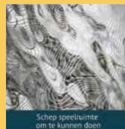
Schep speelruimte om te kunnen doen