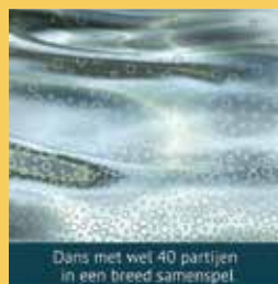
Dans met wel 40 partijen in een breed samenspel