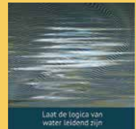
Laat de logica van water leidend zijn