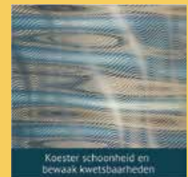
Koester schoonheid en bewaak kwetsbaarheden