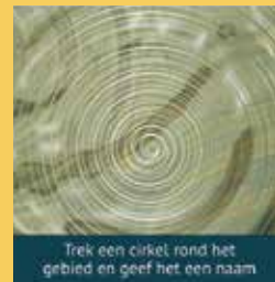
Trek een cirkel rond het gebied en geef het een naam