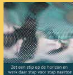
Zet een stip op de horizon en werk daar stap voor stap naar toe