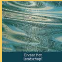
Ervaar het landschap!

www.brantsekempen.eu/portfolio-items/boek-leve-de-kleine-beerze/