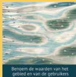
Benoem de waarden van het gebied en van de gebruikers