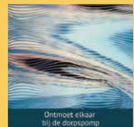
Ontmoet elkaar bij de dorpspomp